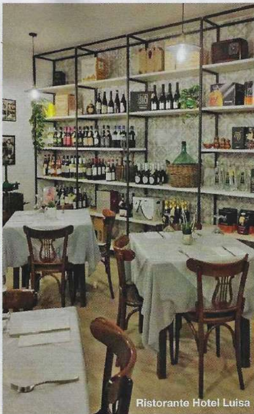
Ristorante Hotel Luisa

INFO Pro Loco di Brenzone sul Garda, località Porto, via Zanardelli 38, 045/742.00.76, www.brenzone.it