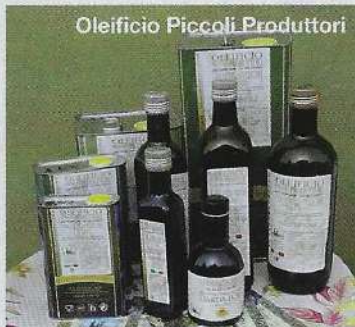
Oleificio Piccoli Produttori