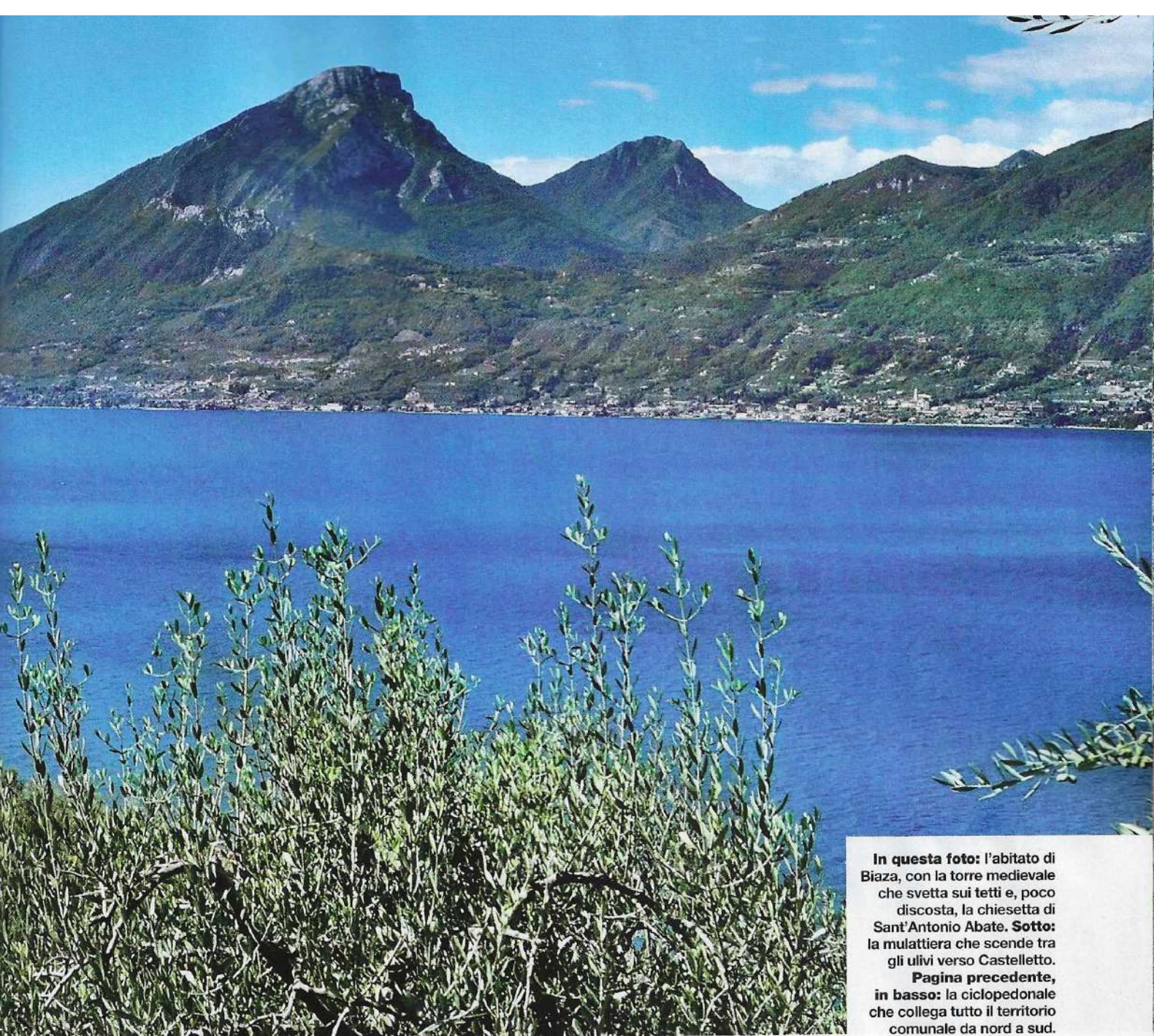
In questa foto: l'abitato di Biaza, con la torre medievale che svetta sui tetti e, poco discosta, la chiesetta di Sant'Antonio Abate. Sotto: la mulattiera che scende tra gli ulivi verso Castelletto. Pagina precedente, in basso: la ciclopedonale che collega tutto il territorio comunale da nord a sud.