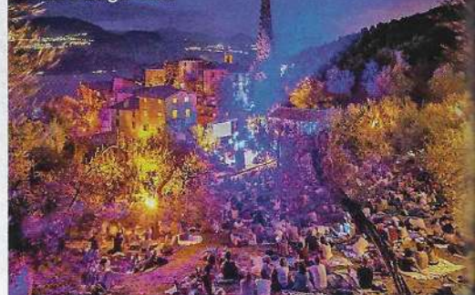
Teatro degli Ulivi

Campo, borgo abbandonato, riprende vita durante l'anno con una serie di eventi che riportano musica e animazione tra le vie deserte. Il fulcro delle manifestazioni è il Teatro degli Ulivi (329/747.71.69), inaugurato nel 2023 accanto alla chiesetta di San Pietro: un anfiteatro naturale immerso in un uliveto dove non ci sono sedie ma solo un prato in dolce pendio che invita gli spettatori a sedersi o sdraiarsi sull'erba. In calendario a maggio Fermare il Tempo , rassegna di arte contemporanea (il 4), e la Merenda nell'Oliveta , il 26. Il clou è in estate con le Notti Magiche (8-11 agosto), organizzate dal 1994 dal Ctg Brenzone, che nel teatro hanno trovato la cornice ideale: quattro serate di concerti e spettacoli sotto le stelle, sullo sfondo del borgo illuminato. Si sale a piedi lungo le mulattiere e dopo lo spettacolo si scende alla luce delle torce.