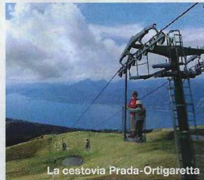
La cestovia Prada-Ortigaretta

Oltre al trekking, Brenzone e il lago offrono molte occasioni di attività all'aria aperta. Per una piacevole escursione in bicicletta c'è la nuova pista ciclopedonale che collega da nord a sud tutto il territorio comunale di Brenzone: un nastro di dieci chilometri che si snoda proprio sulla riva del lago, con 26 ponticelli, slarghi panoramici, panchine per la sosta e anche sei postazioni attrezzate per esercizi ginnici. Si parte da Assenza, con una bella vista sull'isola di Trimelone, e si toccano le frazioni di Porto, Magagnano e Castelletto, ammirando porti, centri storici e chiese romaniche. Dal lago alla montagna: il monte Baldo , detto "giardino d'Europa" per la ricchezza delle sue specie botaniche, è solcato da una fitta rete di sentieri. La vetta