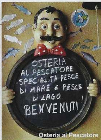
Osteria al Pescatore